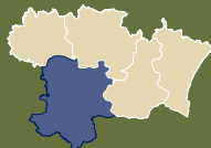
Carte de l'Aude ■ Vallée de l'Aude