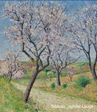
Tableau : Achille Laugé

Le chemin de la Melso vous conduira dans le massif de la Malepère. Sur le parcours, admirez les collines du Razès, les bois de la Malepère, au loin le village de Montréal et sa collégiale et la cité médiévale de Fanjeaux perchée sur son piton. Vers le sud, découvrez le panorama somptueux des Pyrénées, le Pic de Bugarach et le Canigou, point culminant des Pyrénées Orientales.